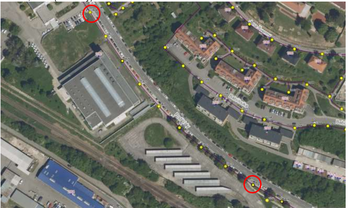
č. 1961, 1970, 1971, 1972 (Vlčnovská)