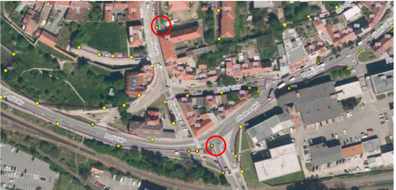
č. 1531 (Na Dlouhých)