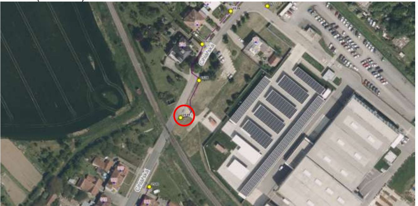
č. 0093 (Luhačovská), 0111 (1. května)